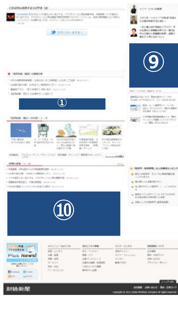
記事詳細ページ下部