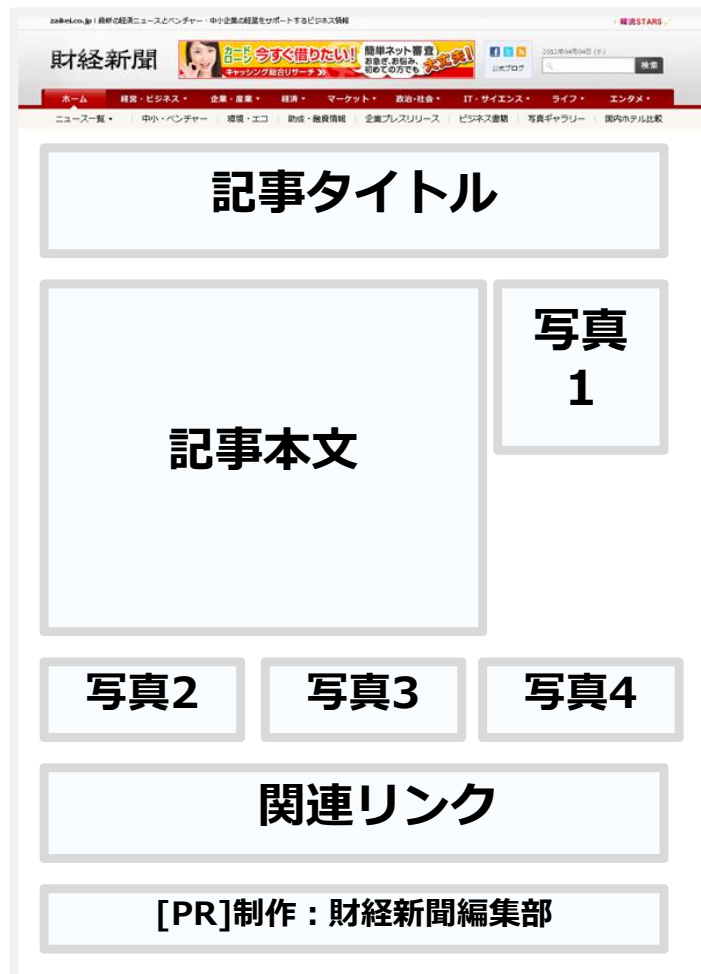
記事詳細面のイメージ (写真の位置は調整可能です)