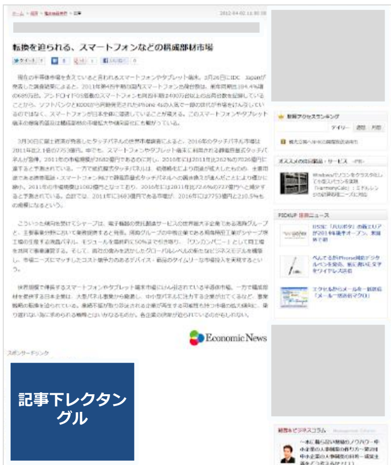
広告掲載面のイメージ

記事詳細面で記事本文の直下に表示される広告枠です。 記事を読み終わった後に自然と目に入るため、CTR（クリック率）が非常に高いことが特徴です。