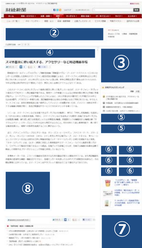
記事詳細ページ上部